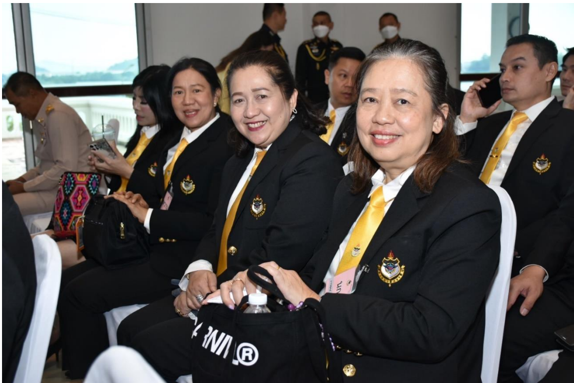
ที่มา : ร่วมรับฟังบรรยายจากผู้ว่าราชการจังหวัดสระบุรี ณ อาคารศาลากลางจังหวัดใหม่