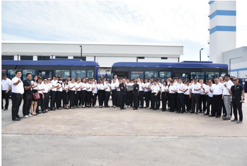
ที่มา : การเยี่ยมชมบริษัท พลังงานบริสุทธิ์ จำกัด (มหาชน)