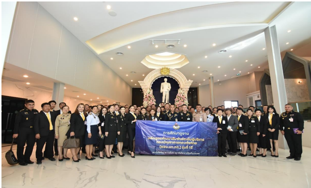
ที่มา : การเยี่ยมชมอนุสรณ์สถานแห่งชาติ

เป็นหน่วยงานที่ต้องทำงานกับหน่วยงานอื่นๆมากมายตาม ความหมายของฟันเฟือง การได้เรียนรู้ประวัติศาสตร์ได้ระลึกถึงผู้เสียสละที่ผ่านมาก่อให้เกิดความเป็นชาติจวบจนปัจจุบันทำให้ เกิดการตระหนักรู้ในการรักษาเกียรติภูมิของบรรพบุรุษรวมถึงหน้าที่ของเราที่ดำเนินอยู่มีส่วนร่วมในการสร้างและ สนับสนุนการทำหน้าที่พลเมืองที่ดีให้กับสังคมทำให้เกิดความมั่นคงและศรัทธา ในขณะที่เดียวการการพัฒนา บ้านเมืองเพื่อให้ประชาชนสามารถเข้าถึงการบริการสาธารณะได้อย่างเสมอภาคและขยายโอกาสในการให้บริการไป ยังหัวเมืองมีใจจำกัดความเจริญเพียงเมืองหลวงทำให้เกิดความมั่นคงทางเศรษฐกิจและโอกาสในการรับบริการจากรัฐ อย่างเท่าเทียมทำให้เกิดความเชื่อมั่นในรัฐก่อให้เกิดเสถียรภาพทางสังคมสร้างความมั่นคงในชาติ